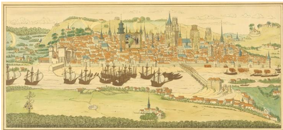
Le livre des fontaines - représentation de la ville et du port de Rouen en 1525 - BM de Rouen - Les foncet sont des bateaux de charge opérant sur la Seine