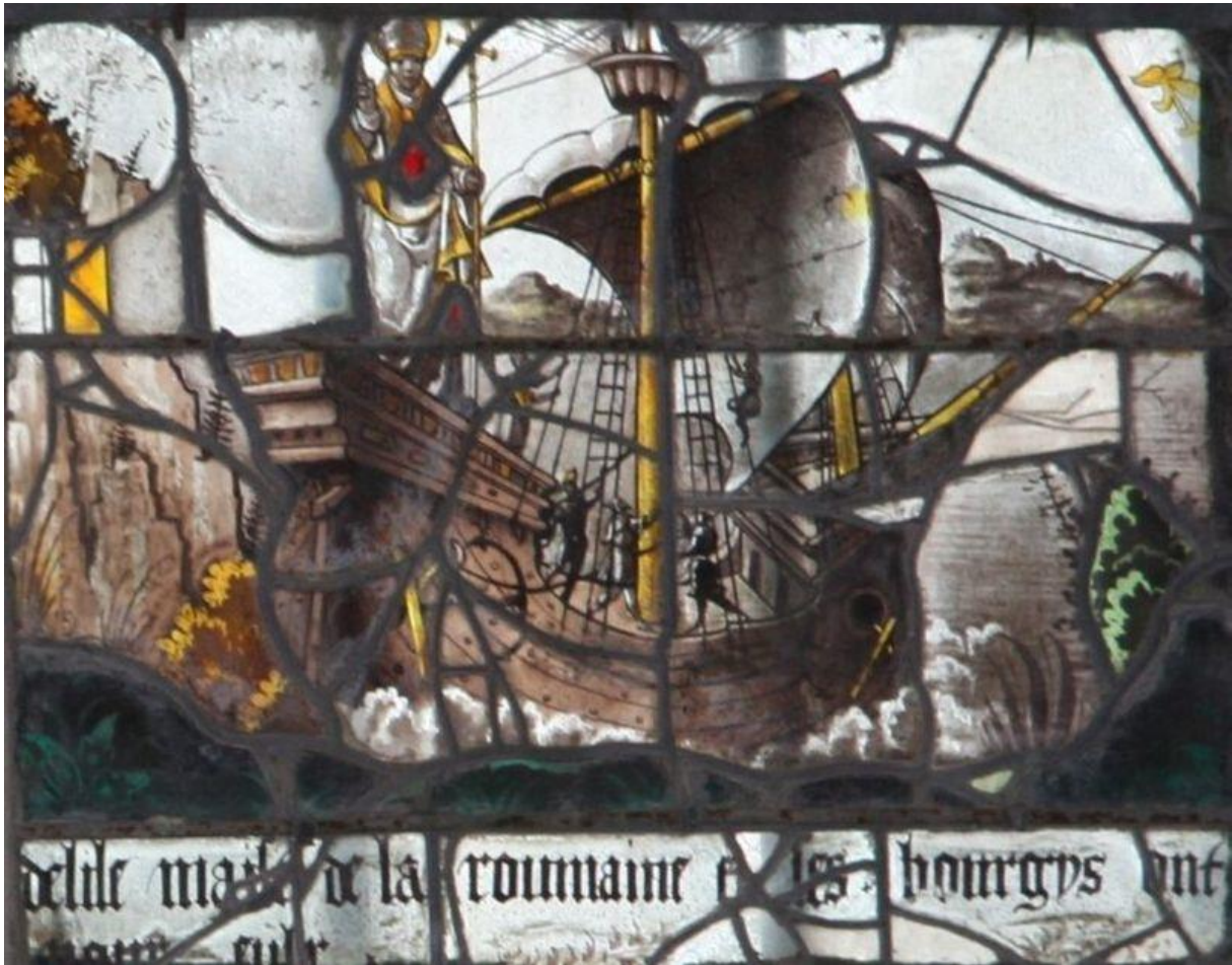
L'expédition de la nef La Roumaine (Romaine) de Jean Fleury (décédé en 1527) année 1528

Eglise Saint-Martin de Vatteville la Rue