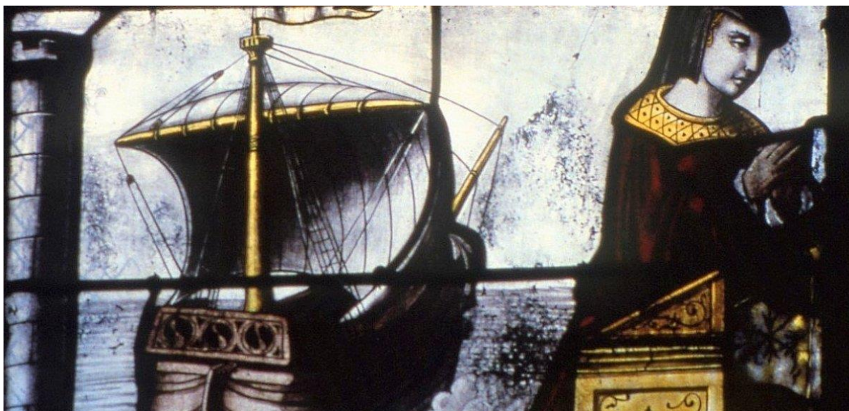
Détail de la baie numéro 7

Voir pour mémoire, le vitrail de Saint-Clément le patron des marins de la paroisse