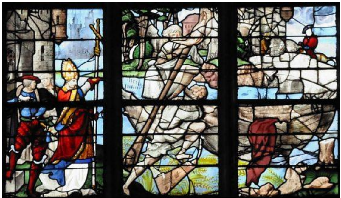
Vitrail de Saint Romain qui arrête une crue de la Seine

Eglise Notre-Dame-des-Arts à Pont de l'Arche