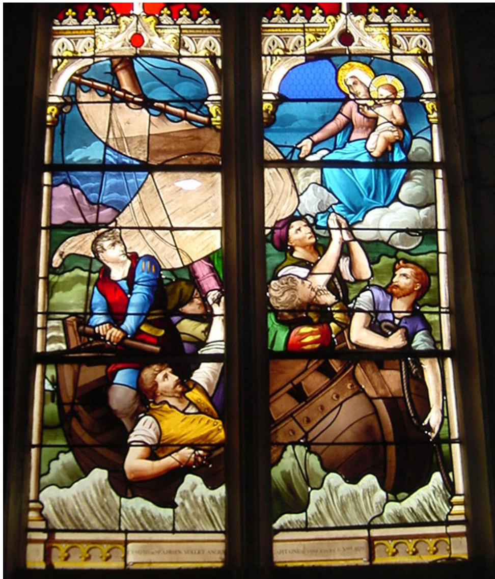
Ex voto marin

Eglise Saint-Mathurin de la Mailleraye – Rives sur Seine