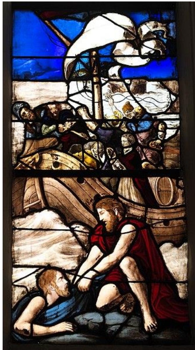
vitrail du XVIe siècle (n° 5) Scènes de la légende de Saint-Nicolas détail du premier plan : sauvetage d'un homme en détresse