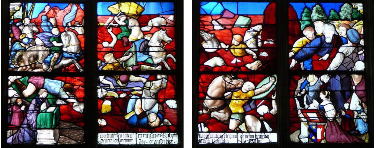
Le passage de la mer rouge

Eglise Saint-Mathurin de la Mailleraye – Rives sur Seine