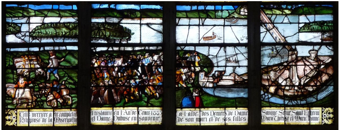
Vitrail daté de 1605 dit du halage ou du montage de la Seine par Martin Vérel